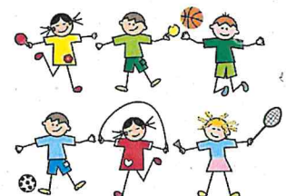
Ihre Ute Wagner-Scheel (Schulleitung)

Ich wünsche Ihnen wunderschöne erholsame Sommerferien und freue mich auf ein Wiedersehen im Schuljahr 2022/2023.